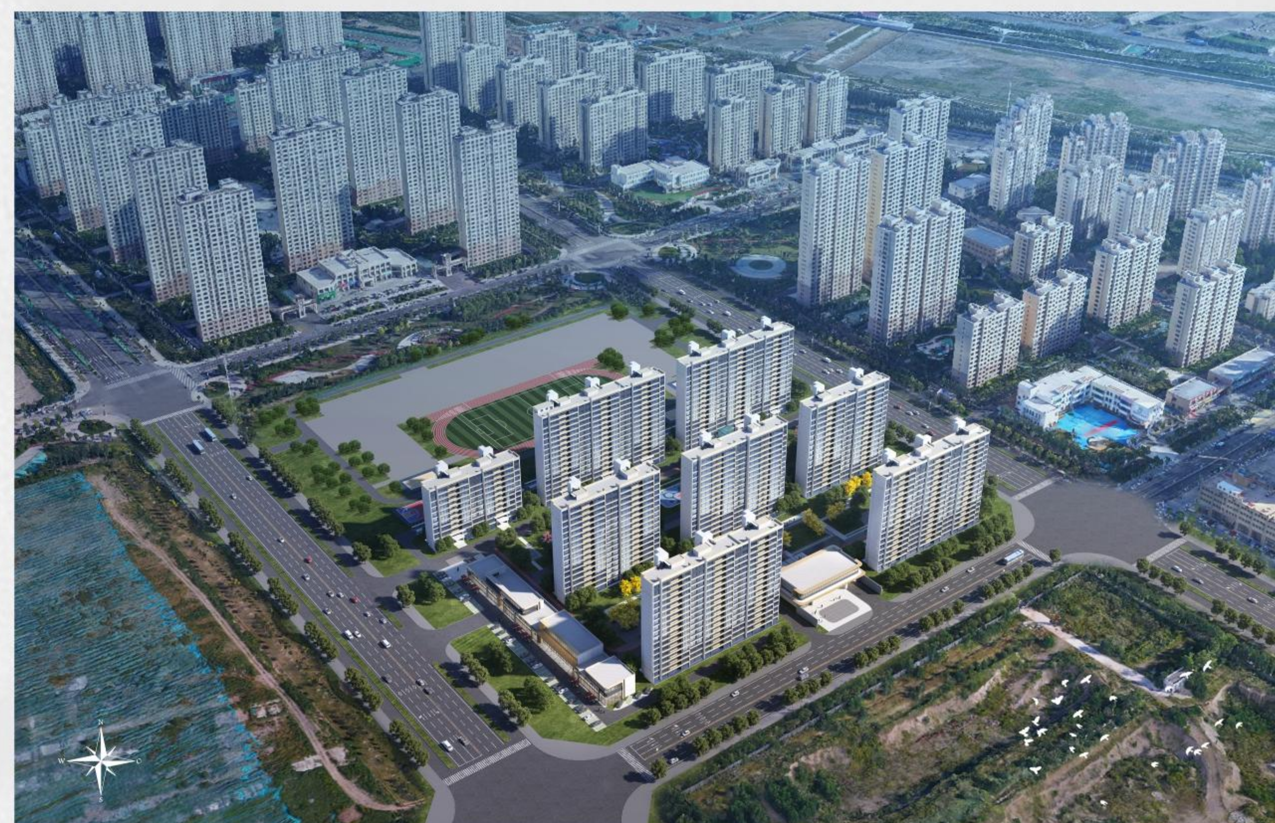
(云河牧歌项目鸟瞰效果图)