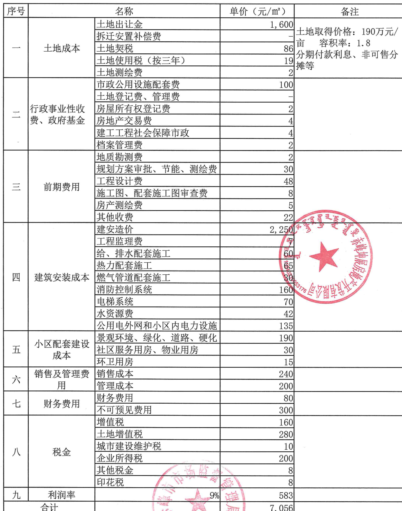
坤厦璟誉住宅房价构成成本测算调查表