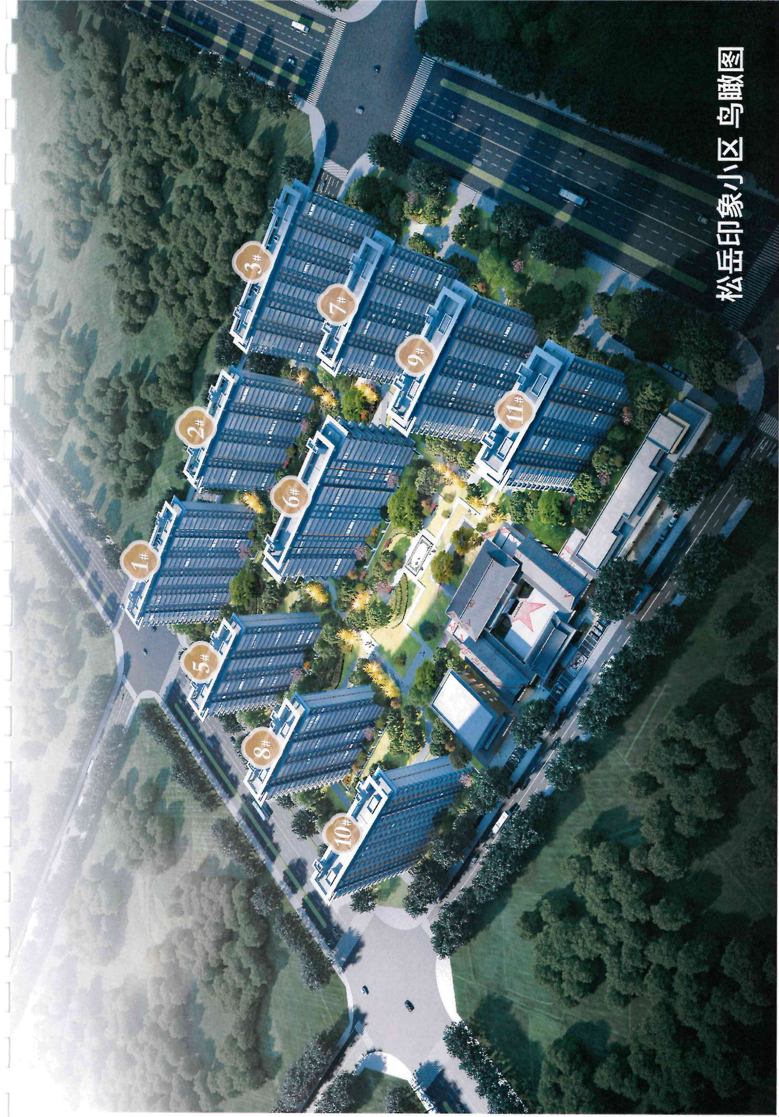
松岳印象小区鸟瞰图